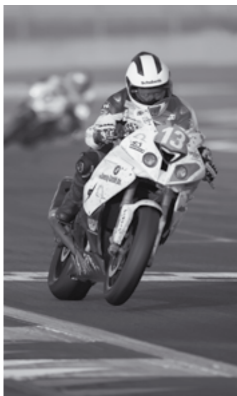
Werner Daemen © Pers Racing L&S

Le secrétariat de la FMWB-VMBB-FMB sera fermé le vendredi 3 juin 2011.